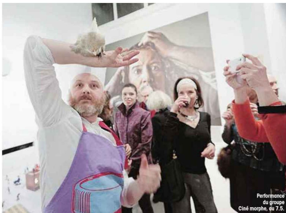
Performance du groupe Ciné morphe, au 7.5.

CE QUE CELA FAIT DE VOUS. Un(e) fêtard(e) très tapis rouge, qui aura peut-être la chance de se remaquiller aux toilettes pour dames à côté d'Audrey Fleurot ou de trinquer avec Yvan Attal.