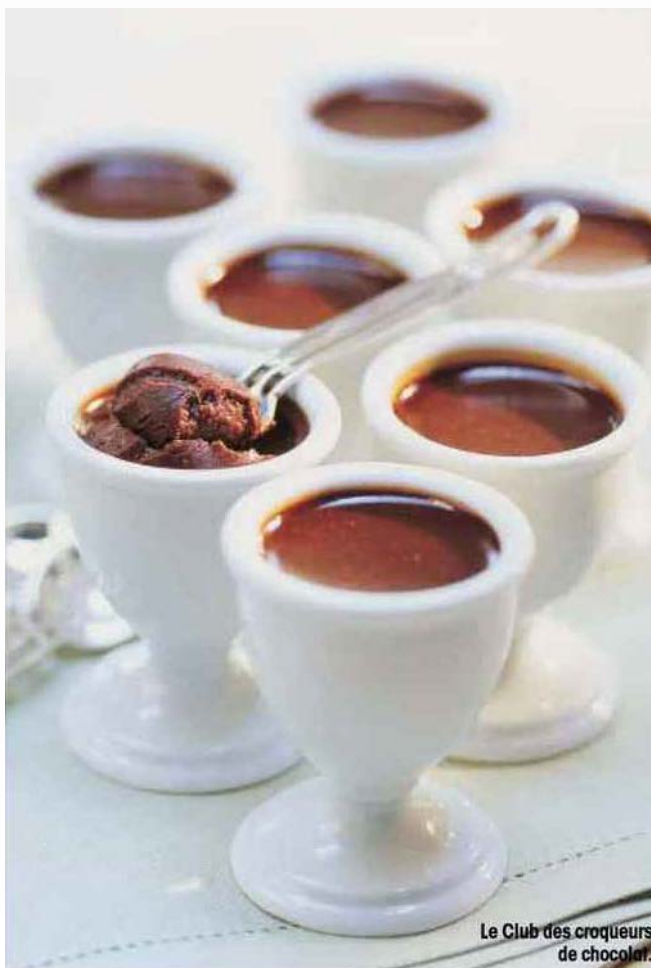
Le Club des croqueurs de chocolat.

QUI EN EST ? 150 membres (dont 100 titulaires). La liste est confidentielle mais certains membres ont cosigné Les 100 Ans du Club des